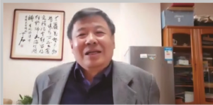
Zhu Guangyao 朱光耀