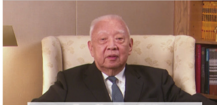
Tung Chee-hwa 董建華