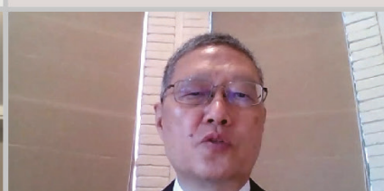
He Yafei 何亞非