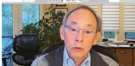
Steven Chu 朱棣文