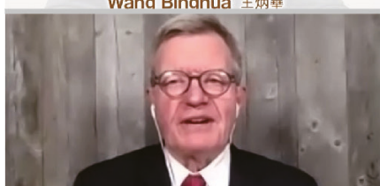
Max Baucus 馬克斯·鮑卡斯