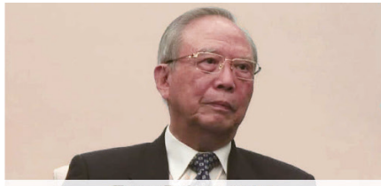
Zeng Peiyan 曾培炎