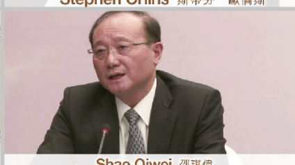
Shao Qiwei 邵琪偉