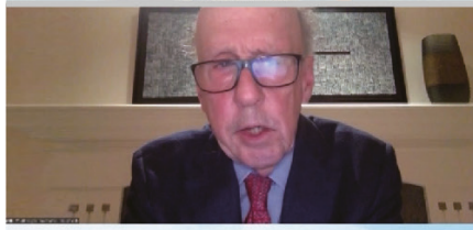
Stephen Roach 斯蒂芬·羅奇