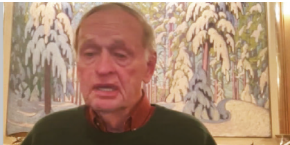
Jean Chretien 讓·克富蒂安