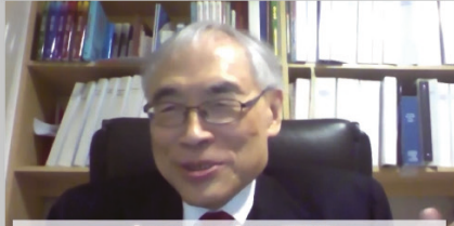
Lawrence Lau 劉遵義