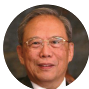
曾培炎 (Zeng Peiyan)