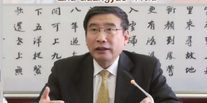
Miao Wei 苗圩